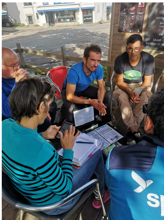
Présentation de la Charte Pêcheurs Partenaires du PNMI à la terrasse d'un café du port de Douarnenez

Les discussions se sont prolongées et terminées à la terrasse d'un café du port, avec notamment une présentation de la charte Pêcheurs Partenaires du Parc naturel Marin d'Iroise.