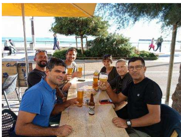
L'équipe du Bus Tour 2022 réunie aux Sables d'Olonne, le premier jour