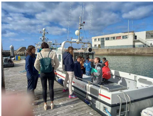
Echanges à quai à La Turballe