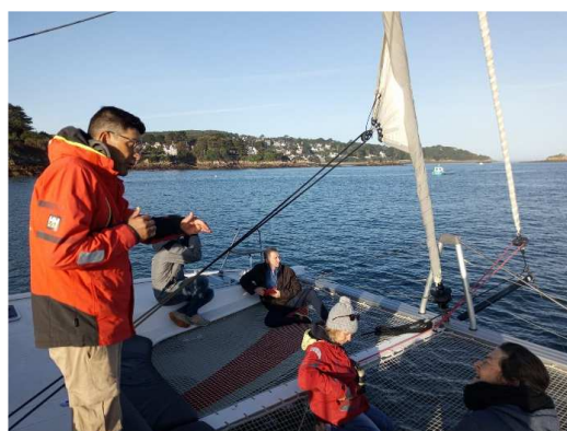
Sortie en baie de Douarnenez pour entamer les échanges à bord d'un catamaran