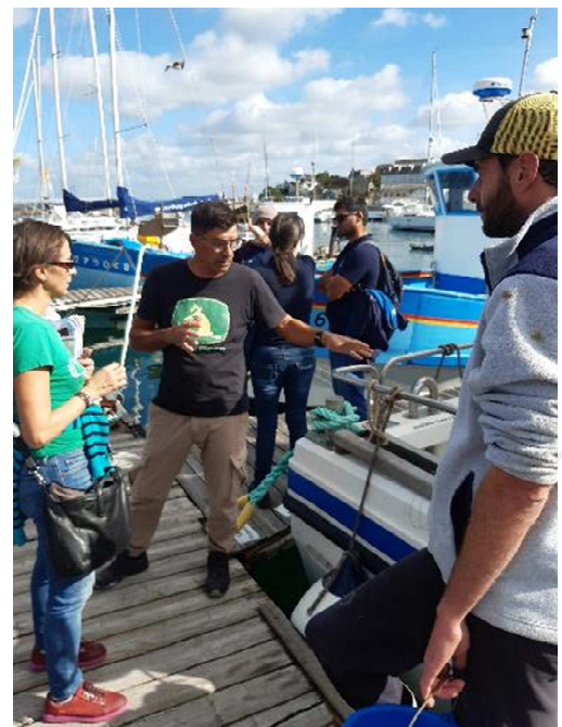
Echanges à quai à Douarnenez