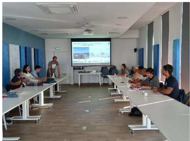
Présentation en salle aux Sables d'Olonne