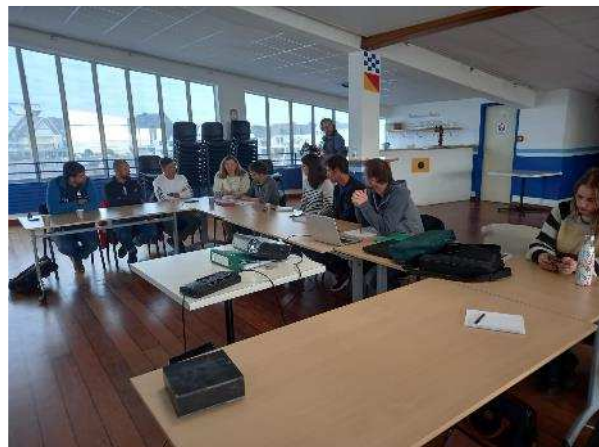
Présentation en salle à La Turballe