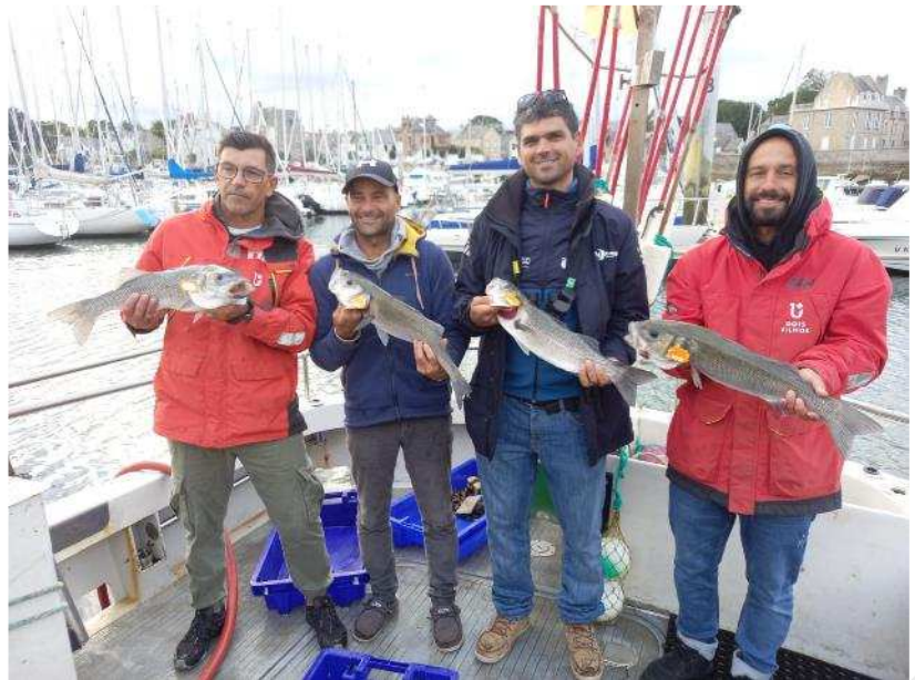
Marée (virage de palangres) partagée avec un palangrier/ligneur professionnel à Piriac-sur-Mer