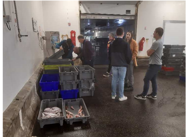
Echanges à quai et à la criée aux Sables d'Olonne