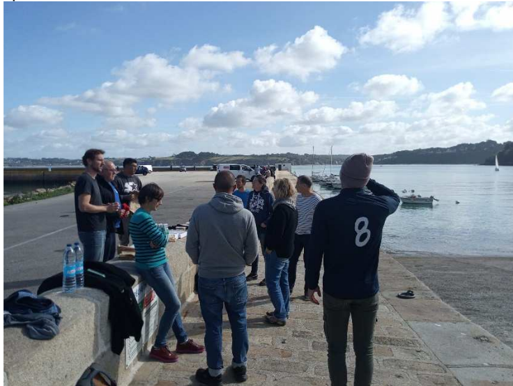
Pique-nique partagé au port du Rosmeur à Douarnenez

Au retour à Douarnenez, les échanges et discussions se sont prolongés autour d'un pique-nique partagé sur les quais du port de pêche.