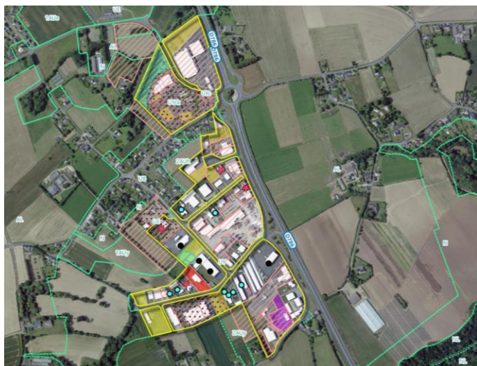
Kéribet - La Ville Auvray