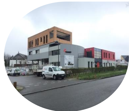
Surélévation en ZAE