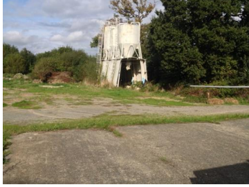
Le site industriel en requalification

La commune de Guipel a engagé dès 2008 une réflexion sur la problématique de gestion du foncier, mue par la volonté de « faire autrement » en matière de politique foncière. Malgré le manque d'expertise et de compétences en internes pour aborder ces thématiques urbaines complexes, la démarche des élu.es a été rendue possible grâce à plusieurs leviers :