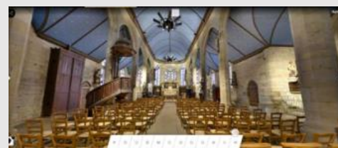
Prise de vue de l'intérieur de l'église après rénovation