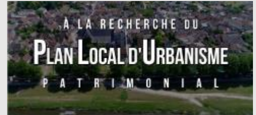
Documentaire pour comprendre les enjeux et résultats d'une recherche sur le PLU patrimonial ( lien )

René LE MOULLEC - Maire de Guéméné-sur-Scorff