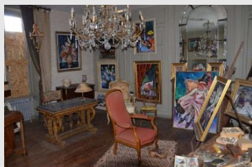
Intérieur de Champlaisir, salle d'exposition

Le territoire de la commune de Retiers accueille « Champlaisir », l'ancienne propriété de Doudou Mahé , artiste peintre breton du 20 ème siècle. La commune a lancé un projet de réhabilitation de ce bâtiment en collaboration avec le Master REPAT et dans le cadre de l'appel à projet « dynamisme des centres-villes et des bourgs » lancé en Bretagne en 2019.