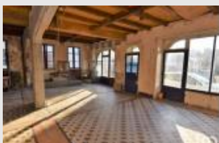
Un vaste espace pour accueillir une nouvelle activité sur le territoire

La collectivité, dans un souhait de vitalisation de son centre-bourg, a impliqué ses habitants à l'aide du pôle de développement de l'économie sociale et solidaire TAG29 dans une démarche de concertation publique et imaginative pour penser les fonctions innovantes d'une future cellule commerciale sur la commune. C'est en passant par les besoins exprimés par la population que les activités ont été imaginées et co-construites, afin de s'assurer de leur bonne appropriation future.