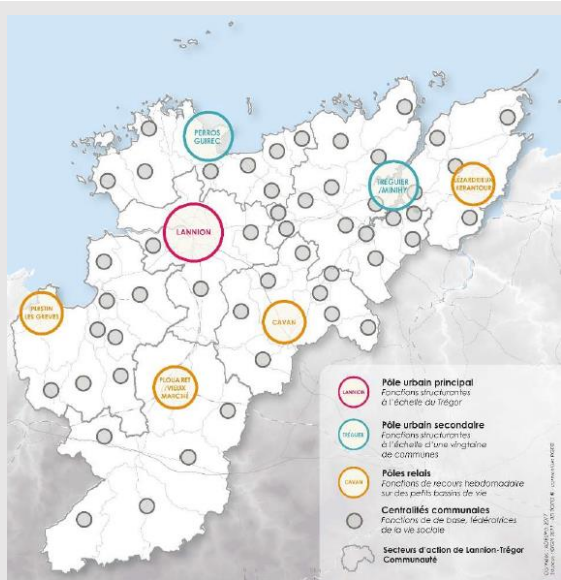
La fonction d'un schéma de référence sur chaque centre

Les démarches entreprises par la Communauté d'agglomération pour renforcer l'ingénierie de proximité: