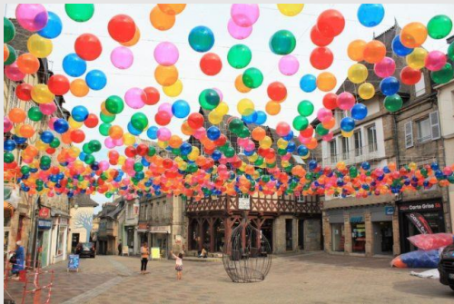
Des aménagements temporaires mais un impact pérenne: 1500 ballons colorés par le collectif d'artistes ImpactPlan

Les clés du succès pour revitaliser l'attractivité commerciale et la rue centrale à Pontivy: