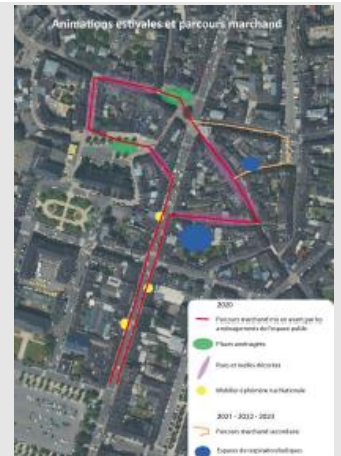
Un parcours marchand spécifique

Les initiatives et actions engagées s'appuient-elles sur un diagnostic des besoins ou s'agit-il plutôt d'impulser une dynamique pour créer la demande?